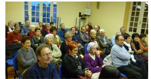
▲ Après « Les Hirondelles », le public découvre Corisande.